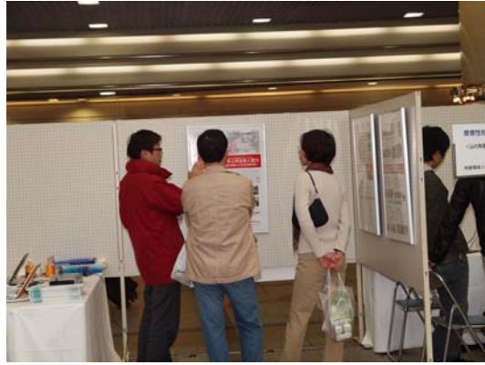
<被災地をつなぎ、記憶をつなぐ>