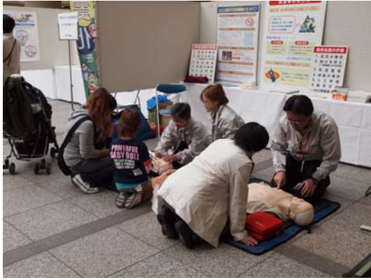
<AED の操作を体験しよう！>