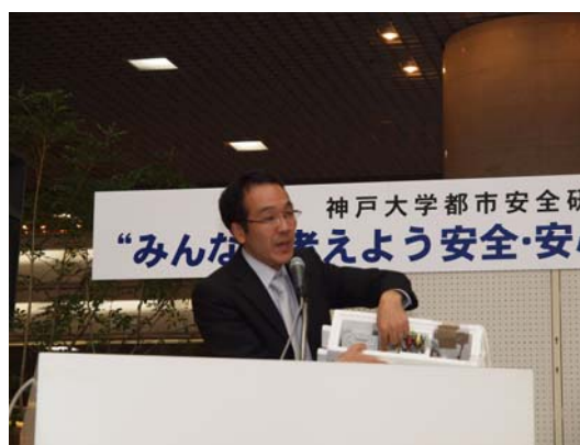
大石先生によるミニ教室

並行して、フロアでは 13 ブースで様々な実演・体験コーナーが設けられ、神戸市・神戸市すまいの安心支援センターや消防局の皆さん、教員、学生によるデモや解説が行われた。