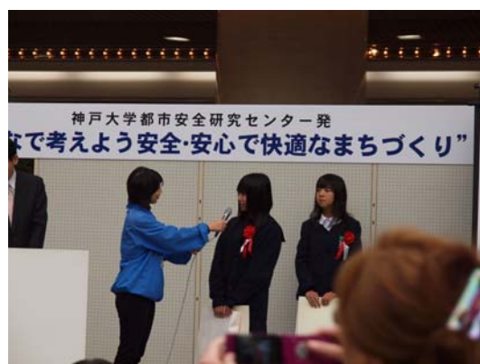
児童画の表彰式の様子